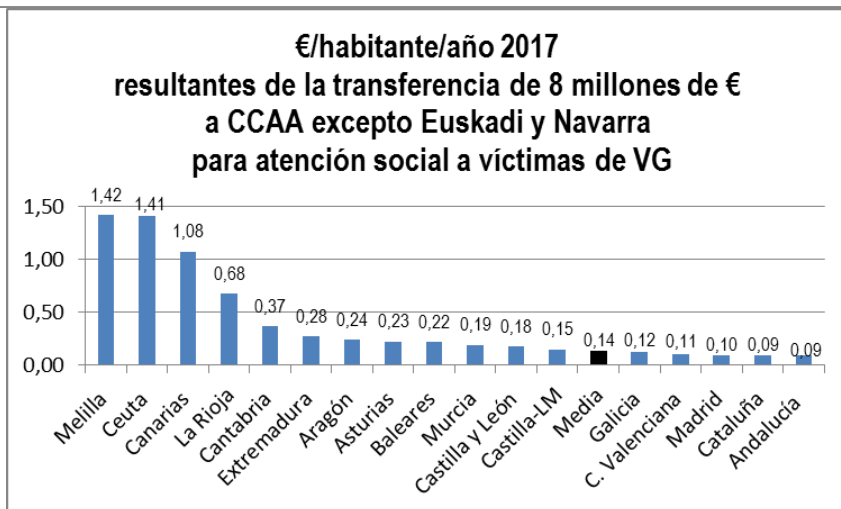
Reparto de los 231,7 millones 2018 por Adm. Territoriales

Pero está en el aire , al no haberse cumplido el plazo de presentación de Presupuestos del Estado 2018 en septiembre 2017